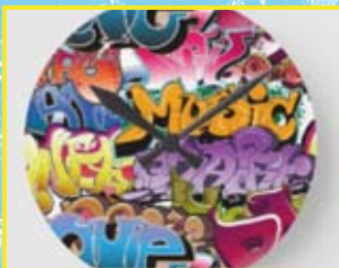
Wanduhr – Farbe

Folgende Produkte kannst du in unseren 4 Bereichen unter anderem herstellen: