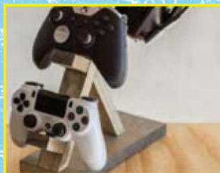
Controllerständer – Holz