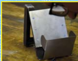
Tablethalter – Metall